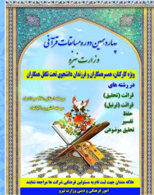
لیست اسامی نفرات اول تا سوم چهاردهمین دوره مسابقات قرآنی همکاران ، همسران و فرزندان دانشجوی کارکنان صنعت آب و برق استان همدان سال ۱۴۰۱